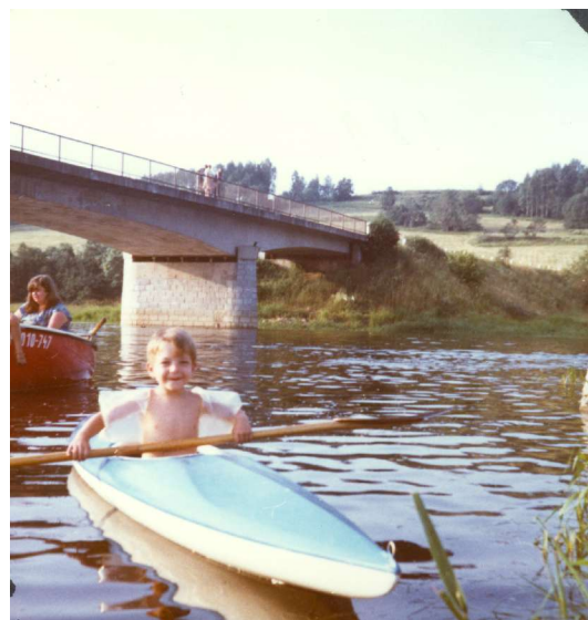
mladý vodák 1981