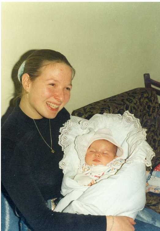
se sestrou Barčou - 1996