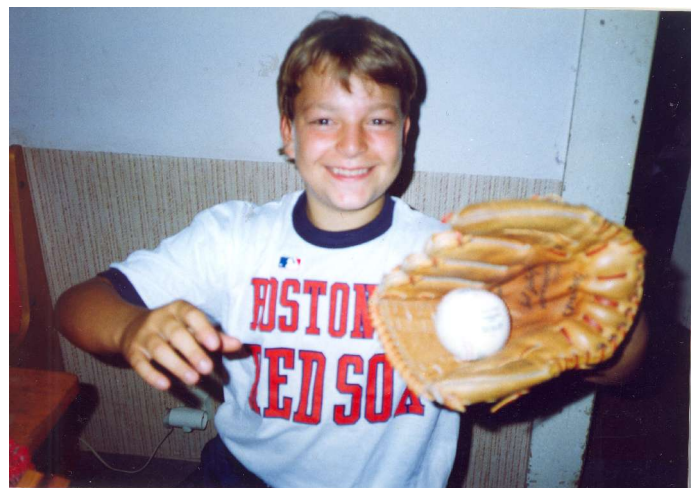
začátek osmileté baseballové kariéry - 1991