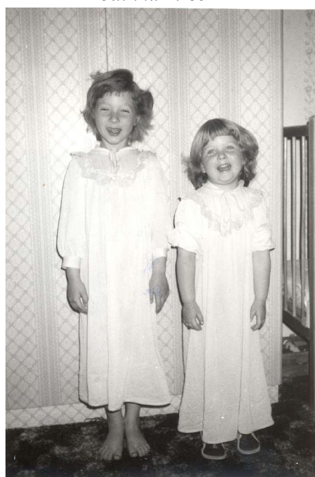
košiláči - 1985