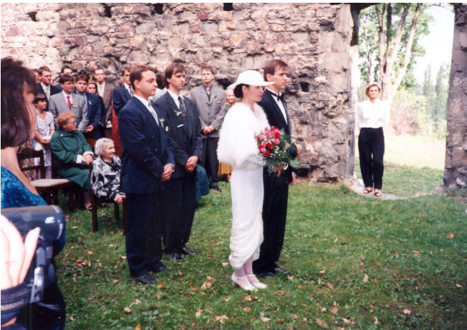
svatba sestry Katky - 1996