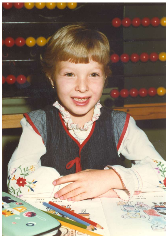
1. třída 1986