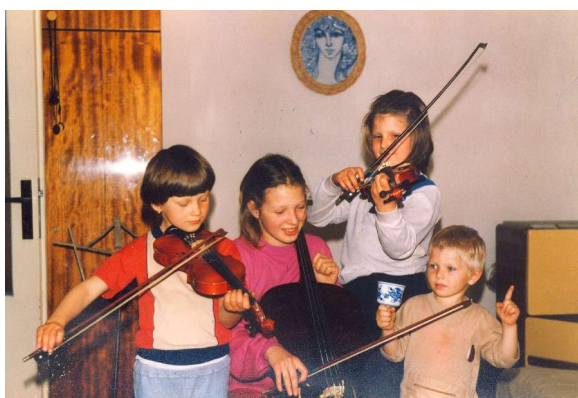
rodinný orchestr - vánoce 1992