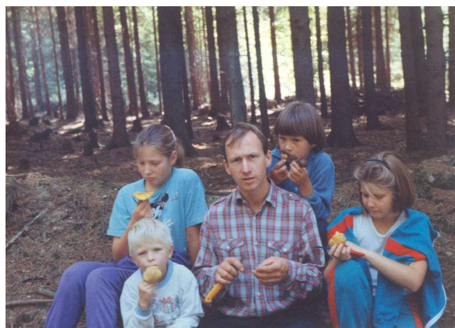
na houbách – léto 1992