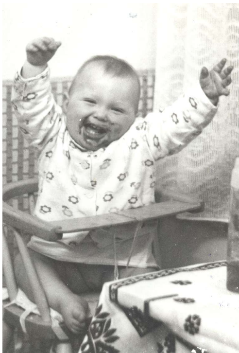
Mňam mňam čokoládové figurky vánoce 1979