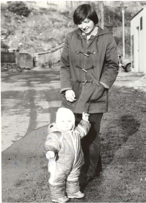
učím se chodit – březen 1980