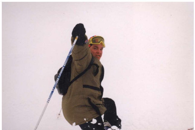
rakouské Alpy 1996