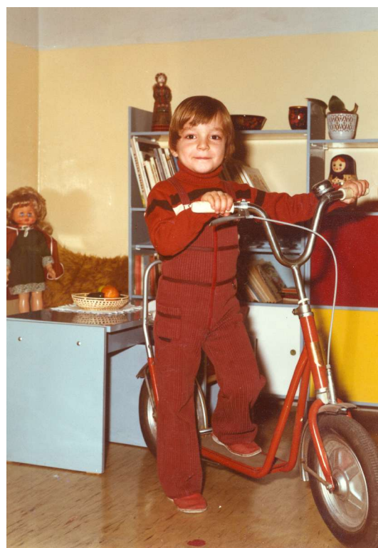
konec školky 1983