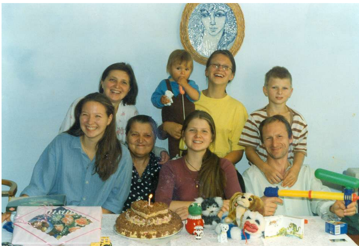
rodina - září 1997