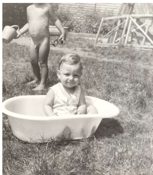
květnová koupel 1979