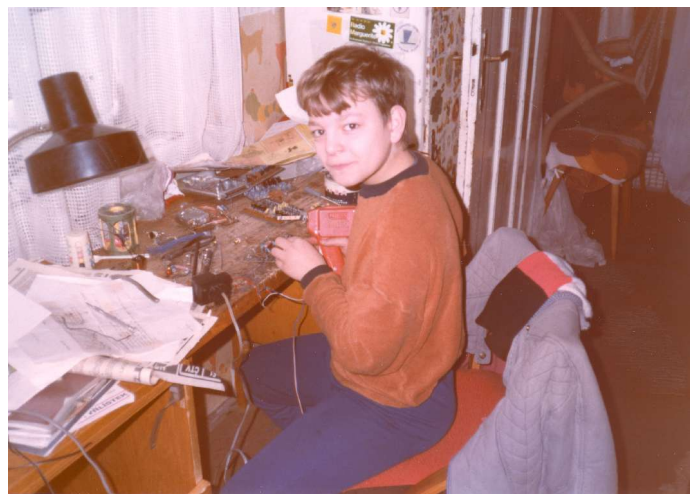
nadaný radioamatér (bastlíř) - 1991