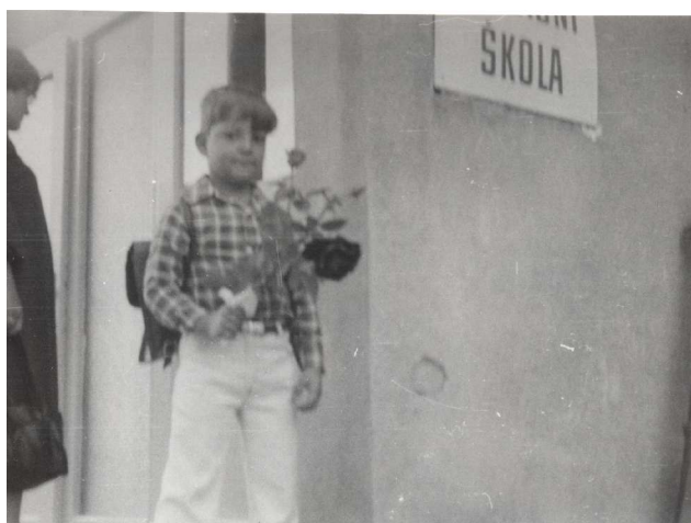
tak už jsem školák - 1. třída 1984