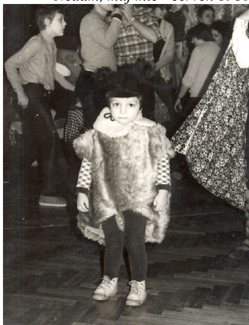
Chtěl bych být, chtěl bych být já medvídkem .... karneval 1980