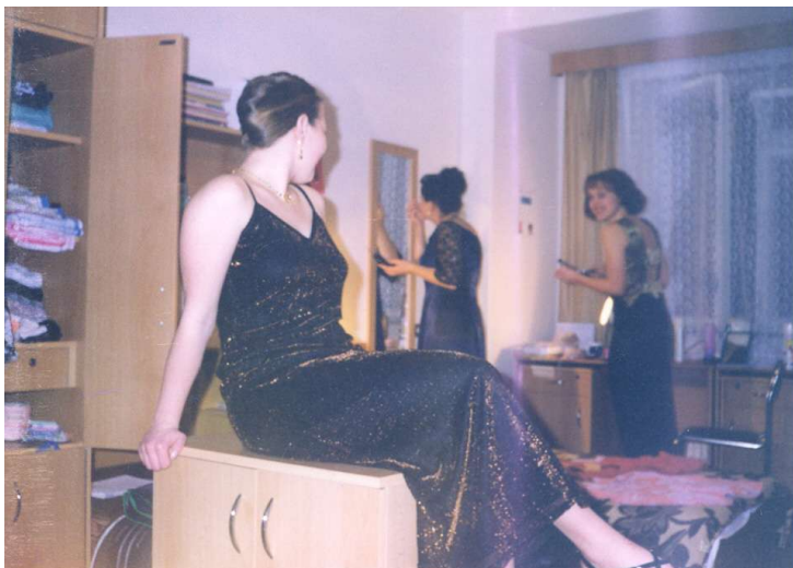
na koleji, příprava na ples - leden 1999