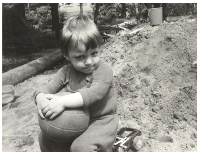
Nedám, můj míč - červen 1980