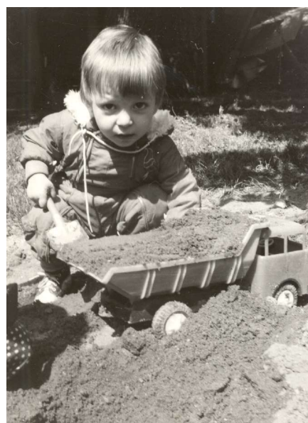
pomáhal jsem při rekonstrukci podlah - červen 1980