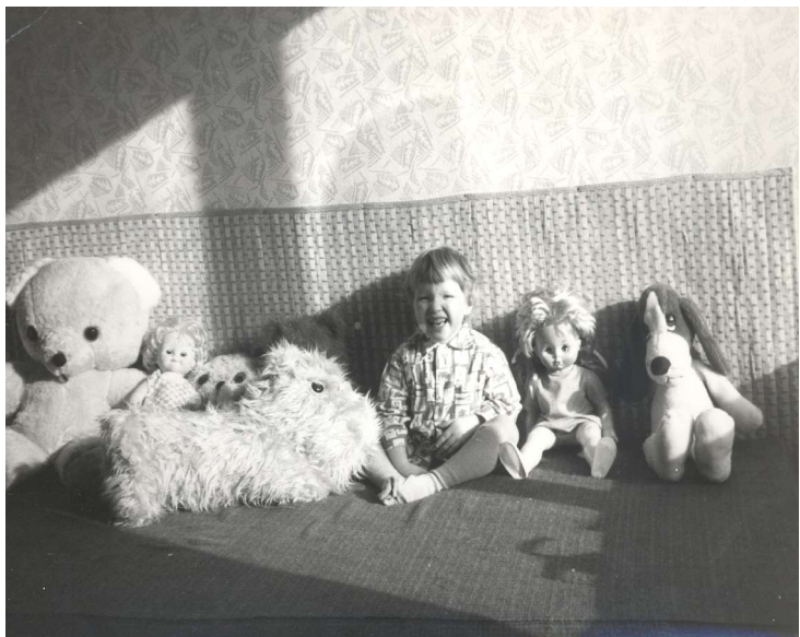
máme rádi zvířata 1982